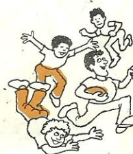
al partido de fútbol